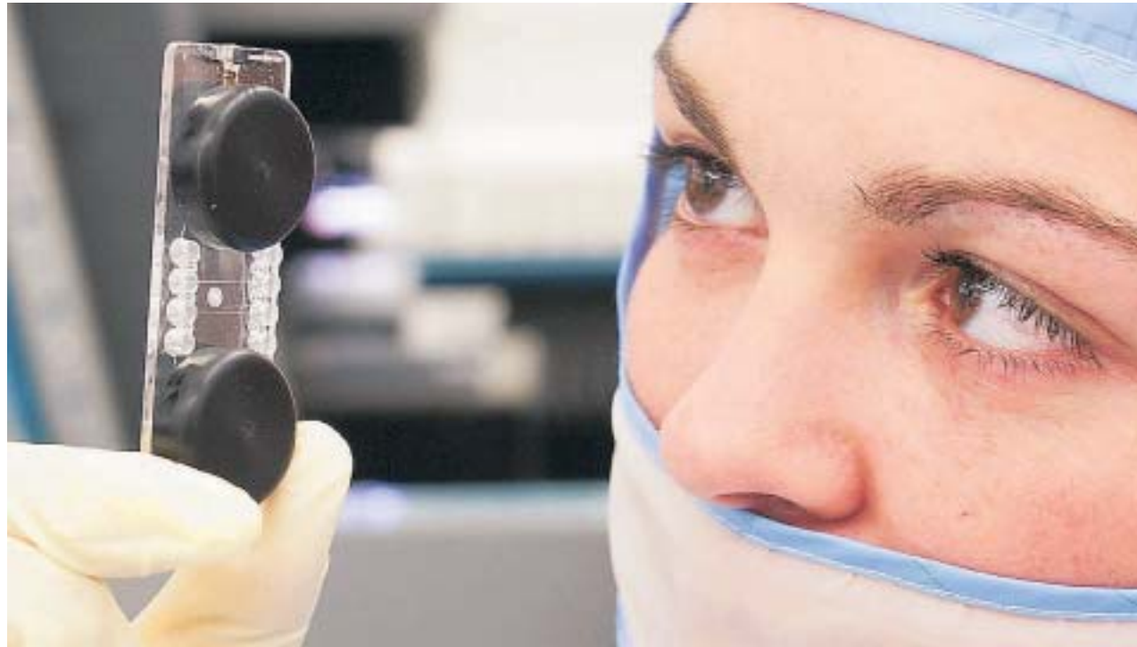
Der Doppelpumpenchip, den die Ingenieurin in ihrer Hand hält, ist eine Komponente des mikrofluidischen Baukastens der thinXXS Microtechnology AG.