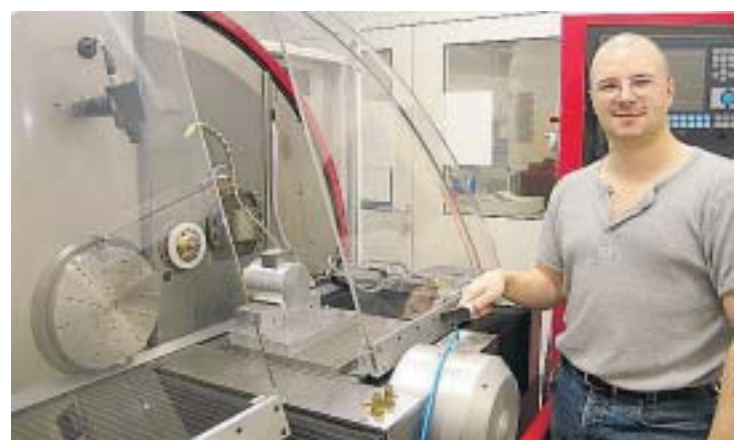
Die Ultrapräzisionsfräse ist das Herzstück. Geschützt durch eine Schleuse sind Temperatur und Luftfeuchte exakt geregelt. Getragen von einem Granitblock, der auf einem eigenen Fundament sitzt, ist sie frei von Erschütterungen.

Gründung vor fünf Jahren im Unternehmen. Eine seiner zentralen Aufgaben ist das Programmieren der Werkzeugmaschinen